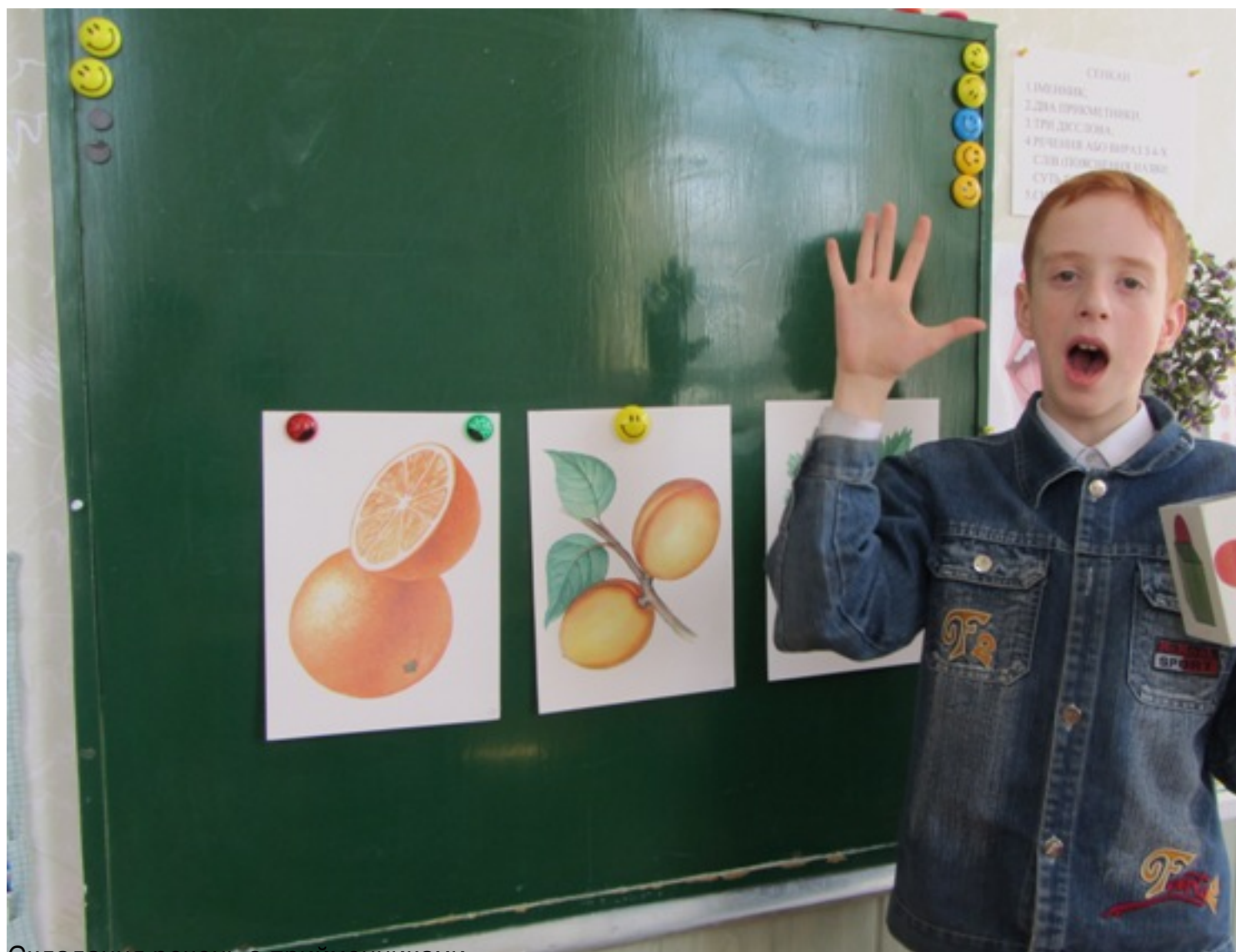
Складання речень з прийменниками.