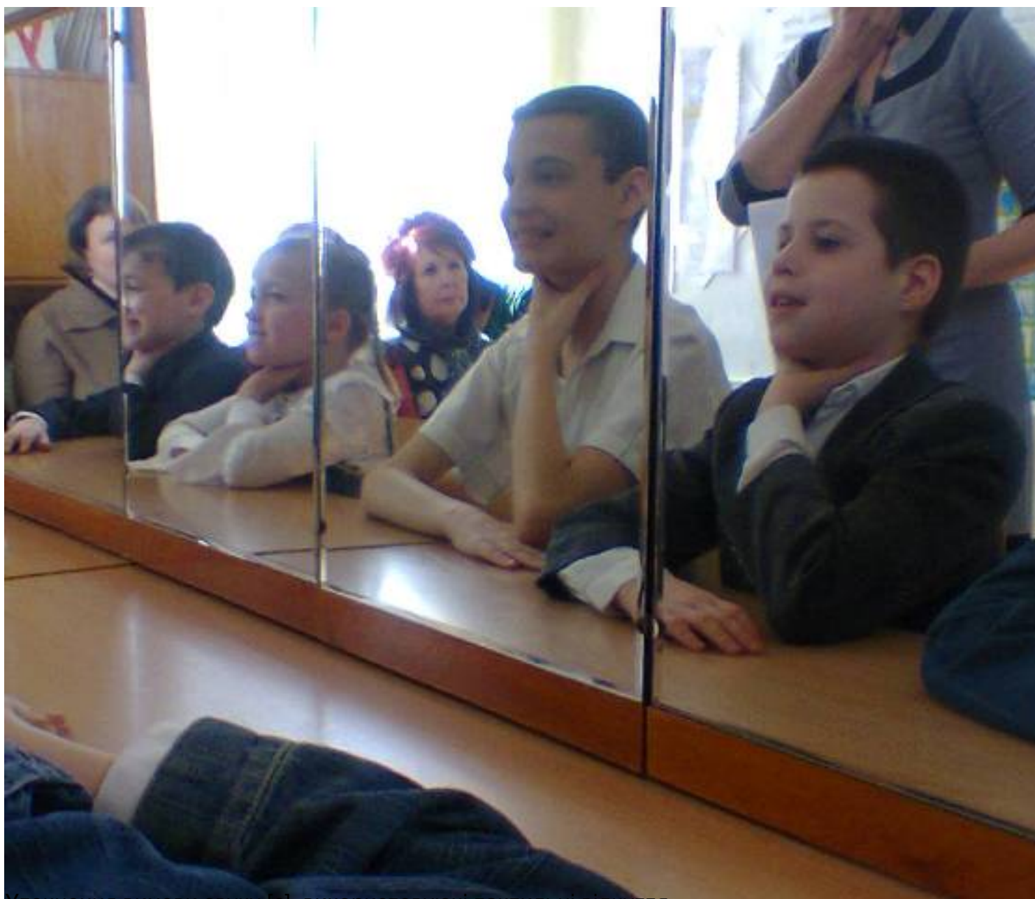
Уточнення вимови звуку [с], використовуючі тактильні відчуття.