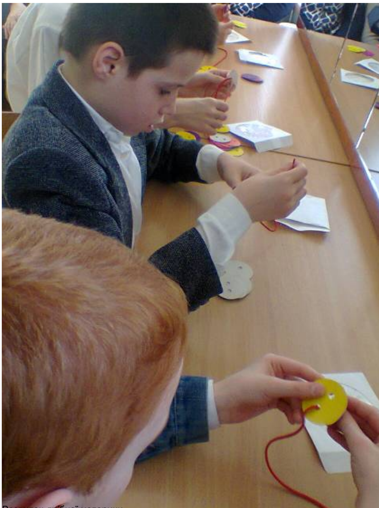
Розвиток дрібної моторики.