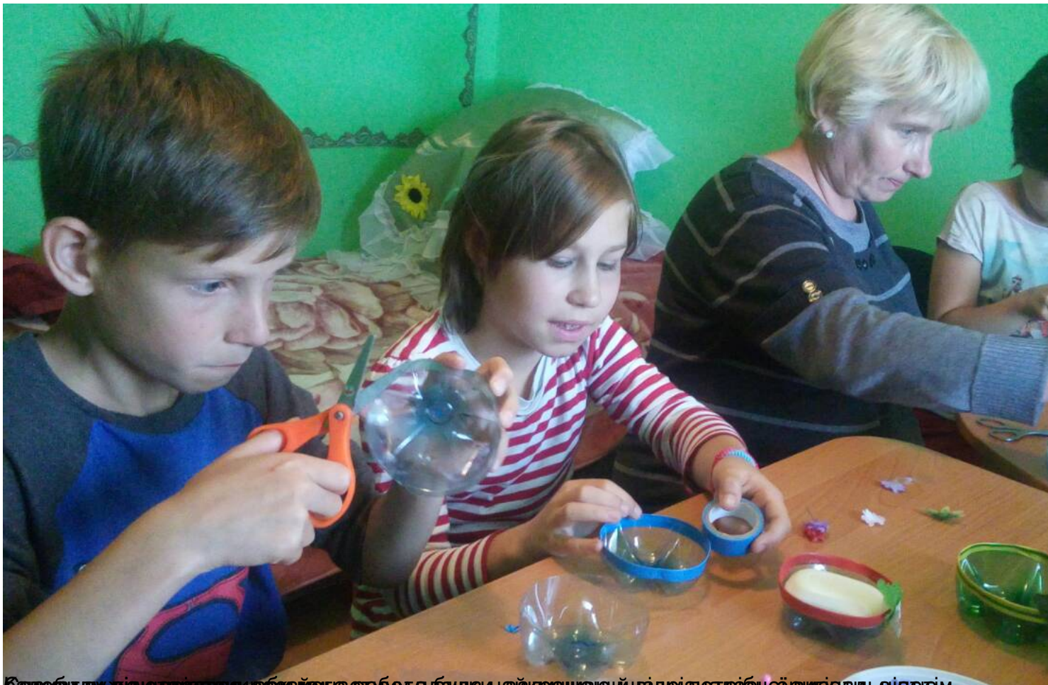
Сьогодні дізналися, як можна зробити башки з крашених відру з пляшок і виготовили віршиком