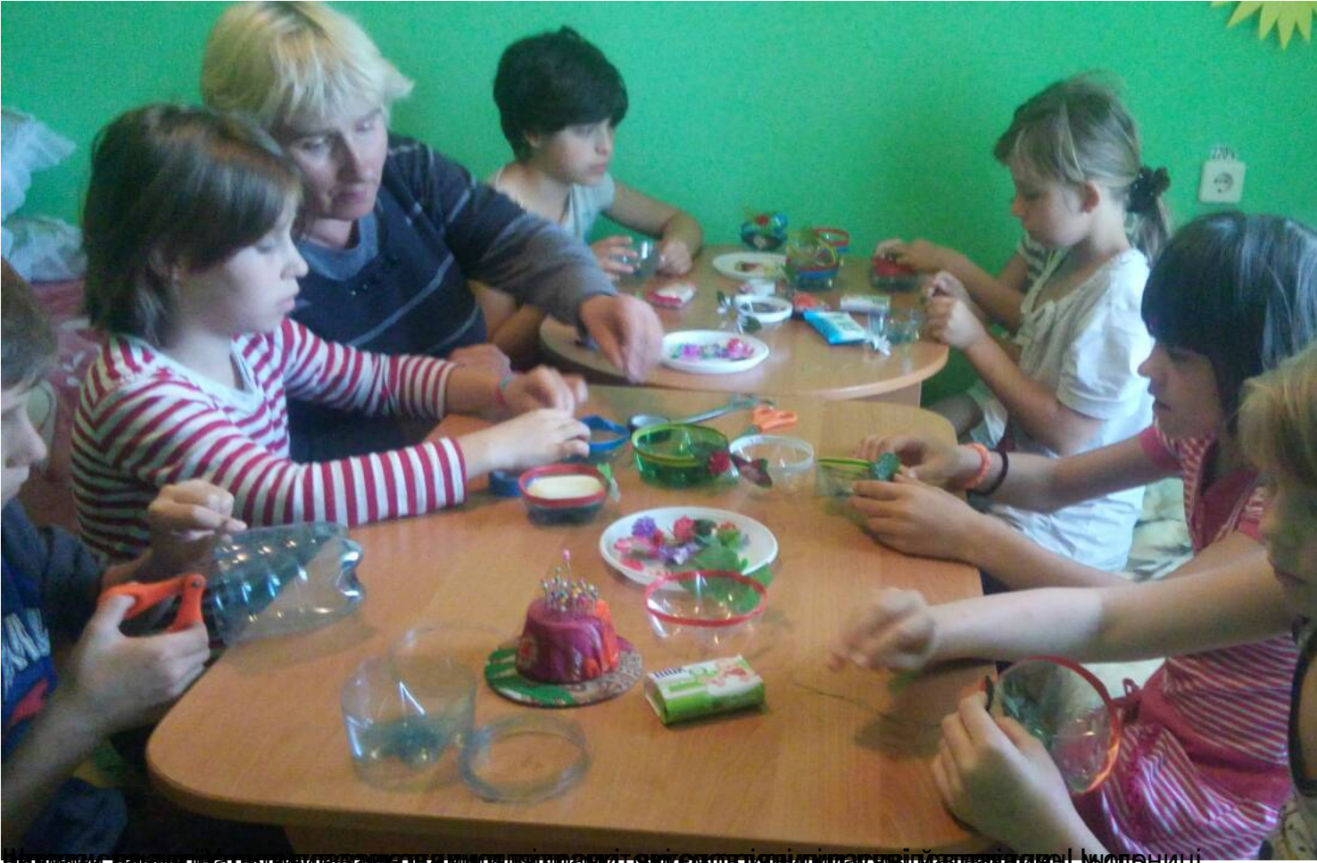
Різдво у нас це свято, яке ми всі любимо, і ми всі разом робимо подарунки для своїх друзів і родичів. Цього року ми зробили подарунки для своїх друзів і родичів.