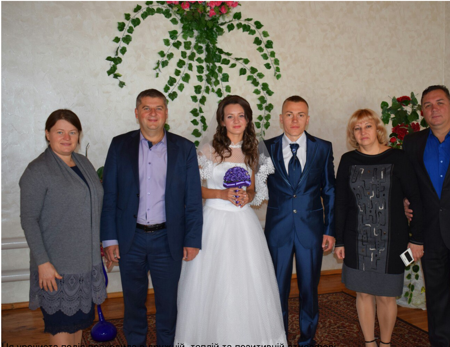
Ця урочиста подія проходила в дружній, теплій та позитивній атмосфері.