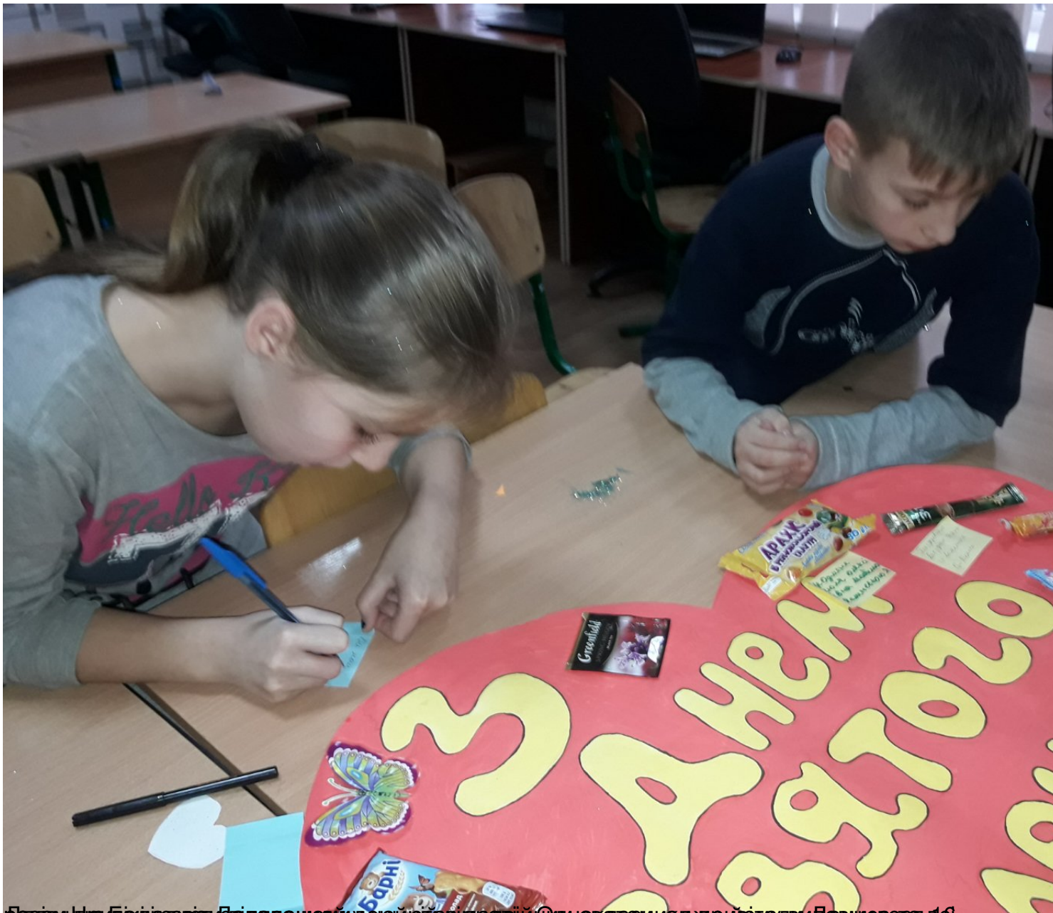
Дівчинка пише листочок для хлопчика. Дівчата ділилися ідеями і ставили свої бажання на великому серці. Дівчата писали листочки для хлопчиків.