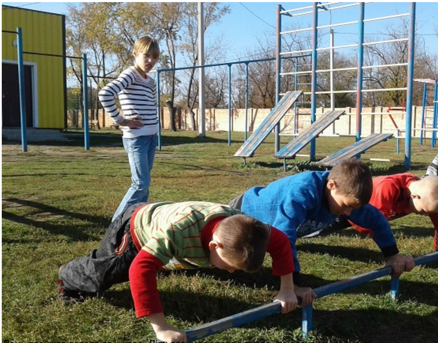
День пройшов весело та цікаво. Діти отримали заряд енергії та позитивних емоцій