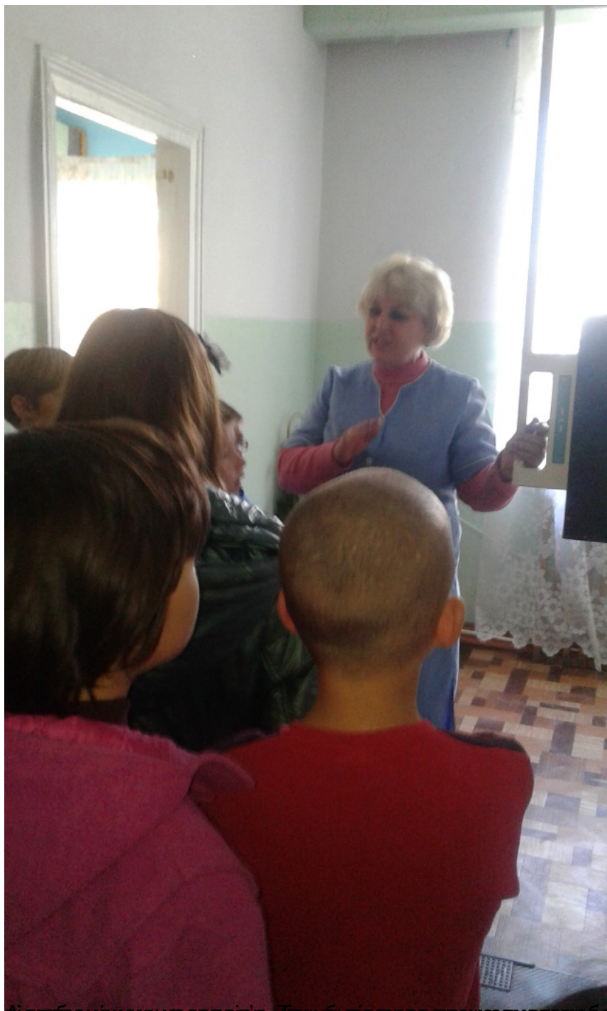
Відпрацьовуємо здорові звички. Найважливіше – це здоровий спосіб життя. У здоровому тілі – здоровий дух