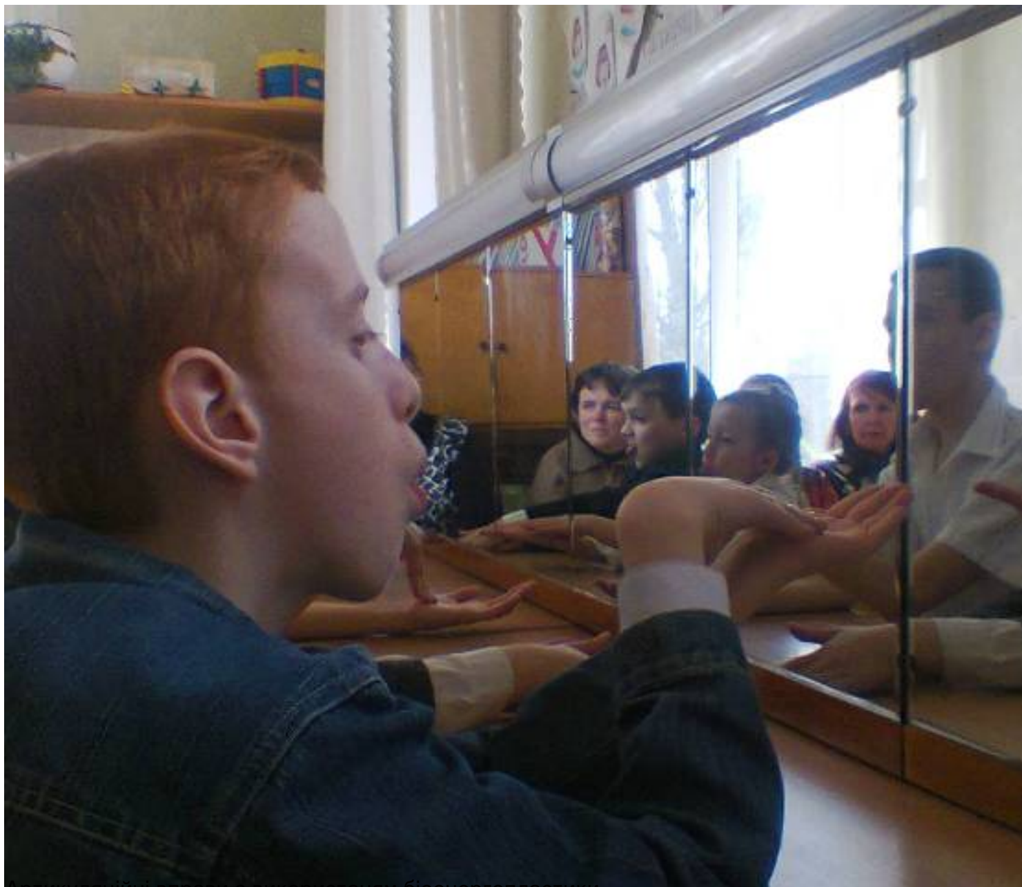
Артикуляційні вправи з використанням біоенергопластики.

Середа, 25 березня 2015, 09:34 - Останнє оновлення Середа, 25 березня 2015, 10:14