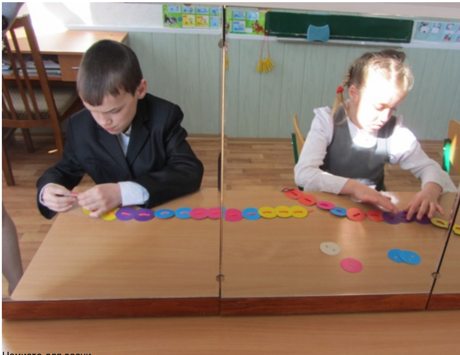
Намисто для весни.

Середа, 25 березня 2015, 09:34 - Останнє оновлення Середа, 25 березня 2015, 10:14